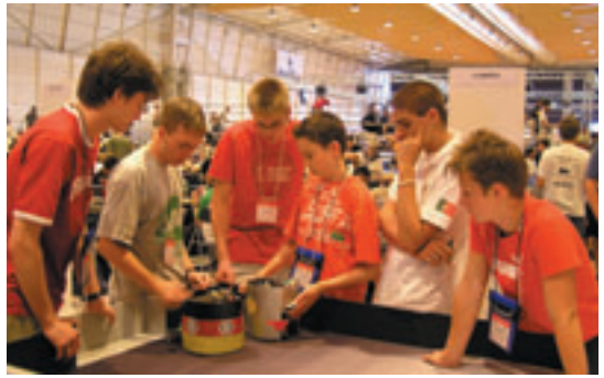
2004リスボン大会 ジュニアリーグ 競技風景

は昨年のリスボン世界大会のヒューマノイド（二足歩行）リーグで優勝しており、2連覇に向けて、大きな期待が寄せられています。皆様ぜひ「ロボカップ2005大阪世界大会」にお越しください。