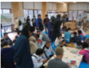
「遊び」～クラフト教室～

同施設は、薪炭林などとして利用されなくなった現在の里山において、「森の学校」をテーマに人と里山との新しい関わり方を模索する場を目指しています。また、豊かな自然環境や多様な生き物の生息空間を後世に残すため、市民協働による里山保全活動を行うとともに、「遊び」「農」「学習」「食」「散策」などの活動を通して「里山文化の伝承」を図っています。