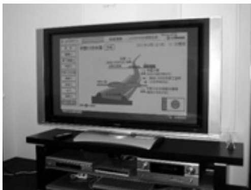
実際のテレビ画面

ネルで放送します。残りの4社においてはテロップを用いた文字情報での情報提供を実施します。