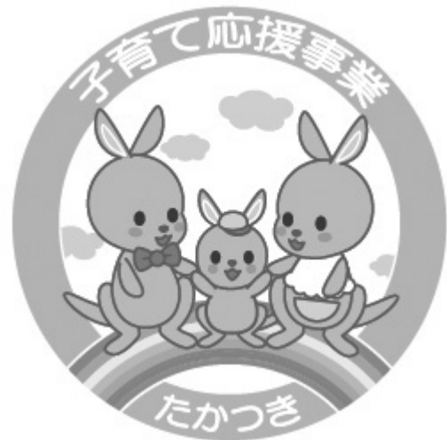
応援事業ロゴマーク

利用できるサービスは、内容により上記のとおり分類しており、平成21年11月現在、69のサービス提供団体、107のサービスが登録されています。