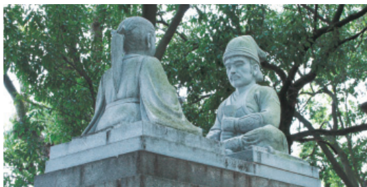
史跡桜井駅跡にある楠公父子別れの石像

駅前にはクスノキの生い茂る史跡公園があります。この地は古代の宿駅の跡といわれ、『太平記』によると、延元元年（1336）、足利尊氏の大軍を迎え撃つため兵庫に向かった楠木正成が、途中、桜井の宿で子の正行に遺訓を残して河内